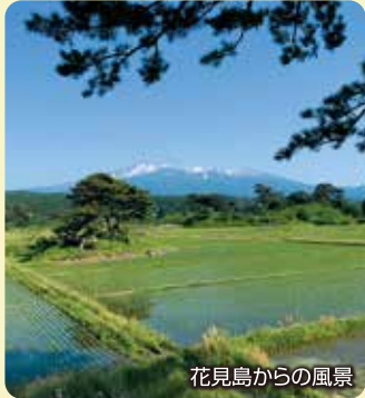
花見島からの風景